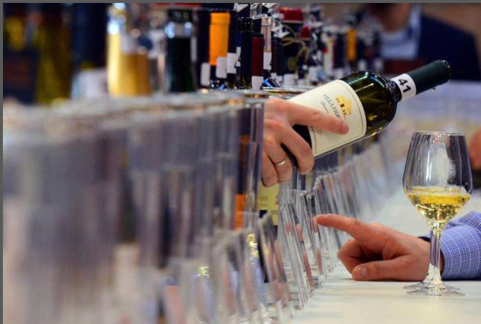
Presentati a Roma vini neozelandesi

Indietro | Stampa | Invia | Scrivi alla redazione | Suggerisci ()